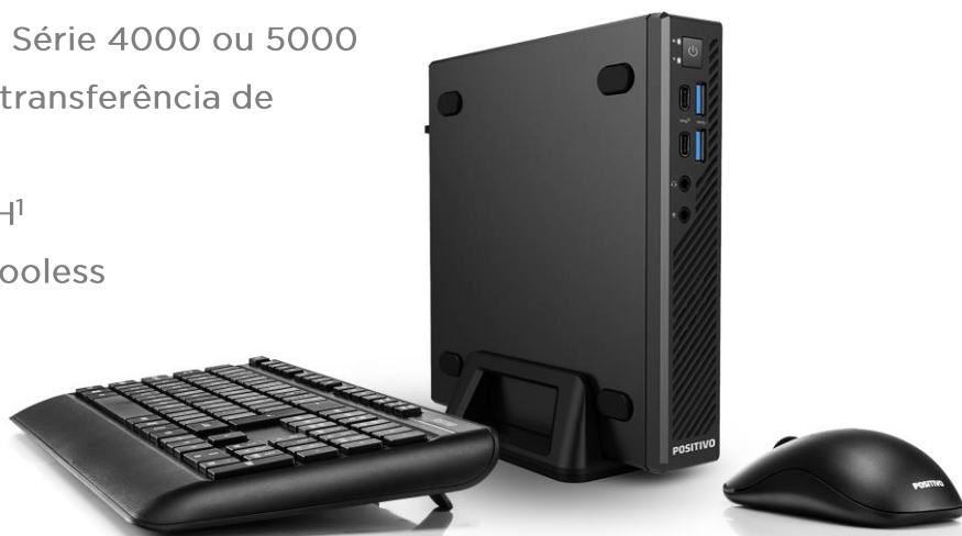
Imagem meramente ilustrativas